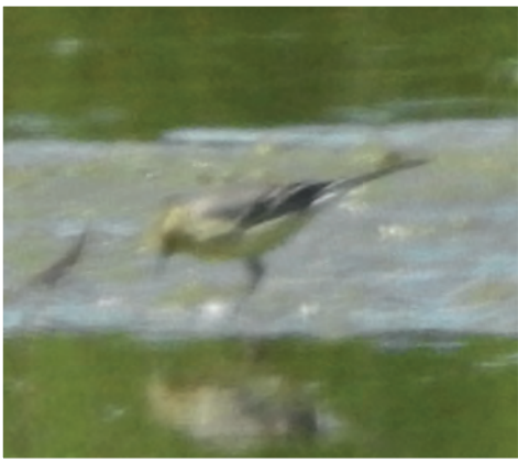
Die Zitronenstelze am Rohrdommelgebiet (Belegfoto)

Die Art brütet im Nordosten Europas und daran anschließend in Sibirien, im Süden bis in den Osten der Türkei. Die Zitronenstelze hat sich in den letzten Jahren weiter nach Westen ausgebreitet und in Folge dessen auch in Deutschland (Greifswald 1996, Havelniederung 1997, Wümmeniederung 2005, Cuxhaven 2013) gebrütet. Es gibt in Deutschland alljährlich Nachweise, vor allem aus dem Frühjahr und dem Herbst. Die Beobachtung ist der erste Nachweis für das Kreisgebiet und der siebte Nachweis für NRW.