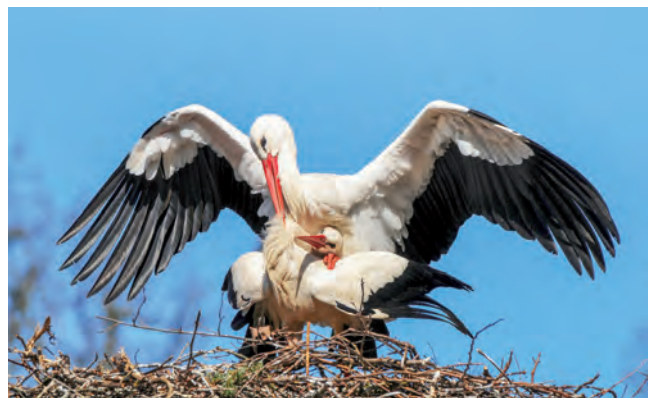
Der Weißstorch brütet seit Jahren erfolgreich in der Büngerner/Dingdener Heide.