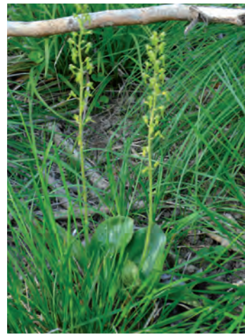
Das Große Zweiblatt auf der städtischen Niederwaldfläche am Hölschendyk (09.06.2014).

Dass wir hier die traditionelle Niederwaldwirtschaft wieder bewundern dürfen, ist eng mit dem Engagement des Hülser