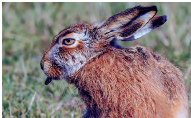
Erfreulicherweise finden Feldhasen im Gebiet noch Wildkräuter.