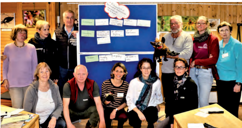
Die neue AG auf ihrem ersten Austauschtreffen; Foto: Benno Grafke