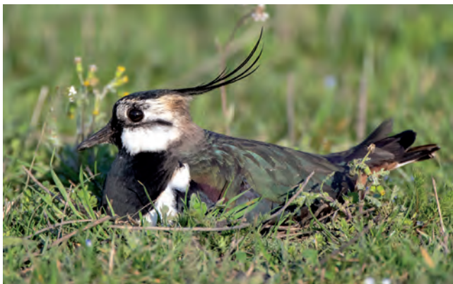
Der stark gefährdete Kiebitz (Männchen) brütet erfolgreich im Gebiet.

Die Stiftung Büngerner / Dingdener Heide besitzt 220 Hektar Fläche in dem Naturareal. Diese werden von 6 Biobetrieben landwirtschaftlich nachhaltig bewirtschaftet. Jede Spende hilft, um weitere Flächen anzukaufen und den Naturraum weiterzuentwickeln: Niederrheinische Sparkasse Rhein-Lippe IBAN: DE40 3565 0000 0000 3329 40 BIC: WELADED1WES