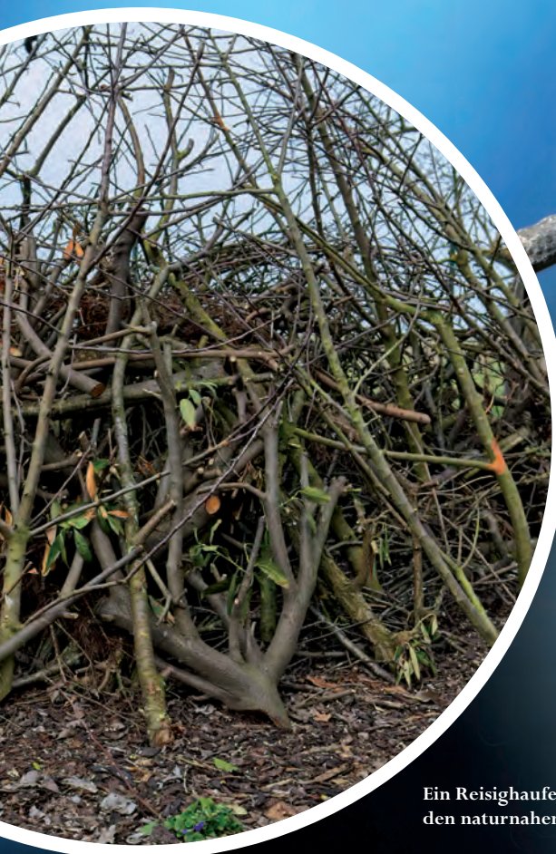
Ein Reisighaufen bereichert den naturnahen Garten.

Im Unterbau werden dicke Äste aufgeschichtet, die viele, stabile Hohlräume schaffen. Je trockener dieses Holz auf dem