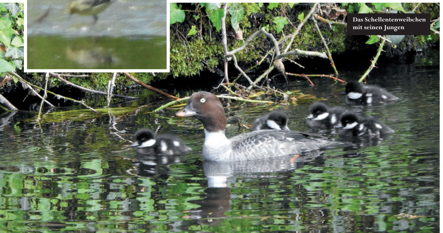
Das Schellentenweibchen mit seinen Jungen