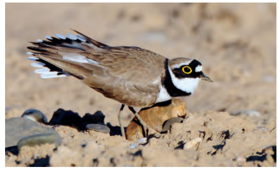
Eine Balzpose des Männchens