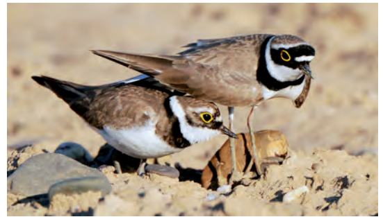
Das Weibchen (links) begutachtet die vom Männchen gebuddelten Nestmulden.