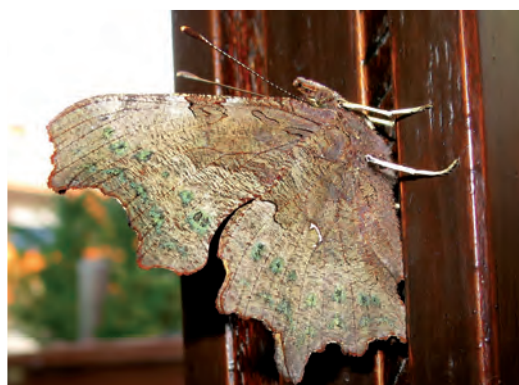
Nun hat er seine Flügel geschlossen; das weiße C ist deutlich sichtbar.

Mitte Oktober 2018 besuchte mich bei schönem Wetter und geöffneter Terrassentür ein Schmetterling im Wohnzimmer. Letztlich landete er auf dem Fensterrahmen in der Küche, zeigte seine ganze Schönheit, bevor er die Flügel schloss und auch nicht mehr öffnete. Nach einer Drehung wollte er sich offensichtlich kopfüber hängend zur Ruhe begeben.