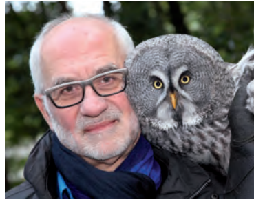
Peter Malzbender