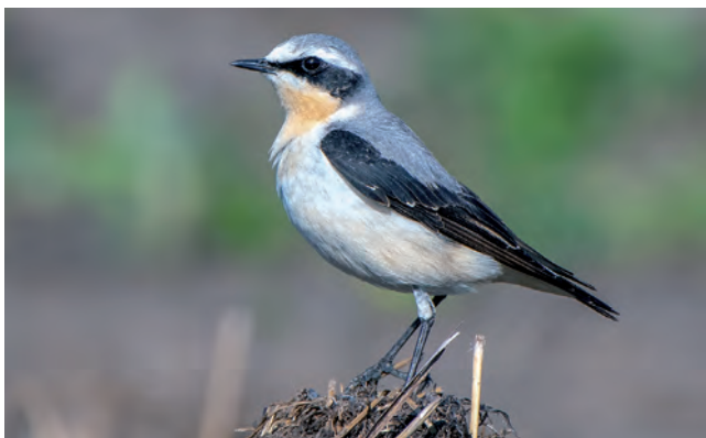
Der Steinschmätzer ist regelmäßig zur Zugzeit hier anzutreffen.