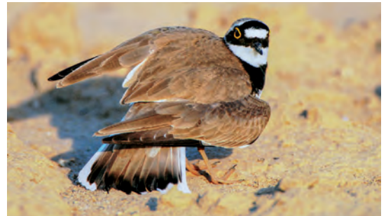
Bei Gefahr stellt sich der Flussregenpfeifer flügelahm, um vom Brutplatz wegzuleiten.