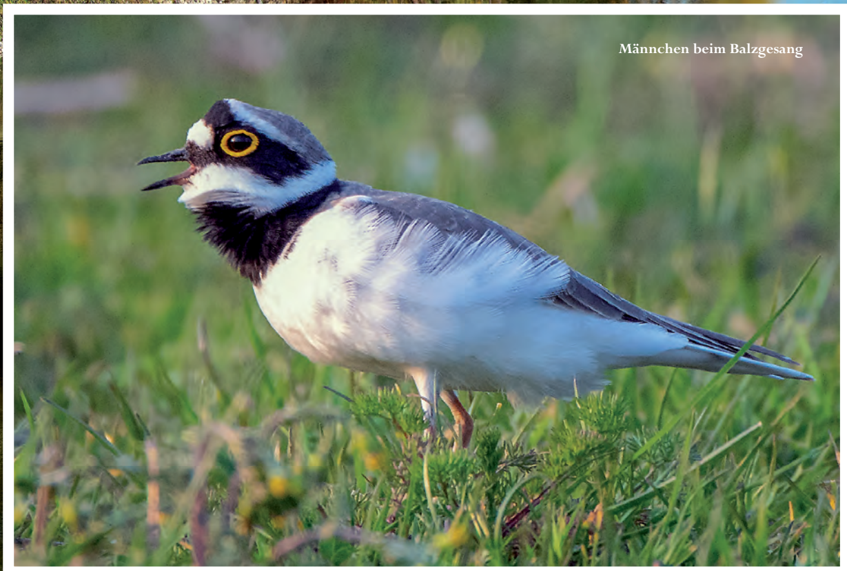
Männchen beim Balzgesang

Der Klimawandel lässt zunehmend Feuchtgebiete austrocknen. Viele Arten werden am Niederrhein verschwinden.