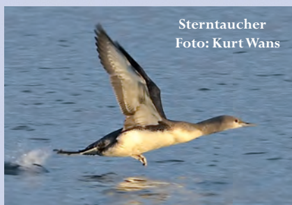
Sternaucher