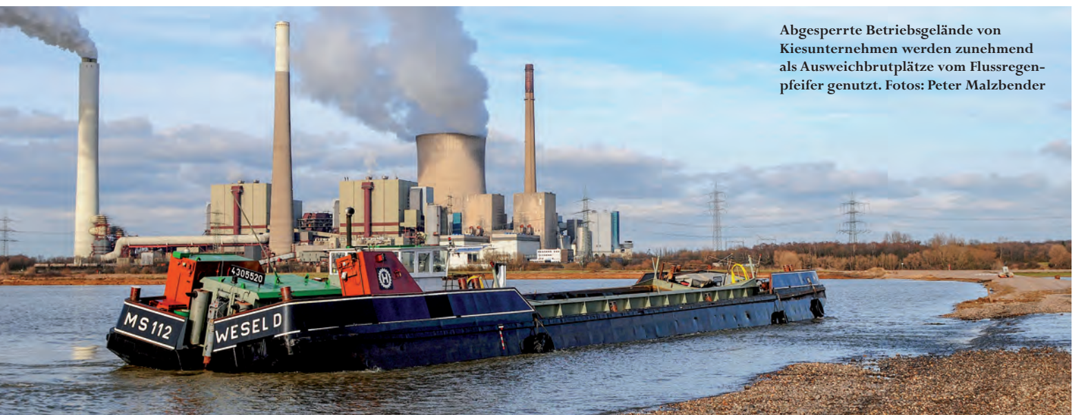
Abgesperrte Betriebsgelände von Kiesunternehmen werden zunehmend als Ausweichbrutplätze vom Flussregenpfeifer genutzt.