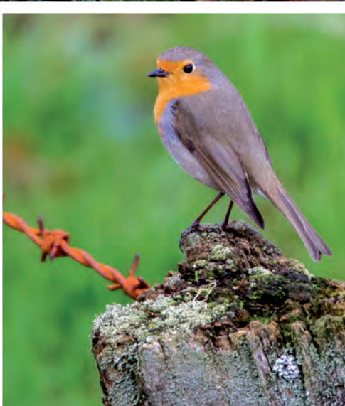
Dieses Rotkehlchen konnte Walter Beske aus Hamminkeln mit seiner Kamera festhalten.