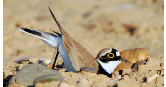
Nestmulde scharrend: Das Männchen scharrt mehrere Nestmulden zur Auswahl.