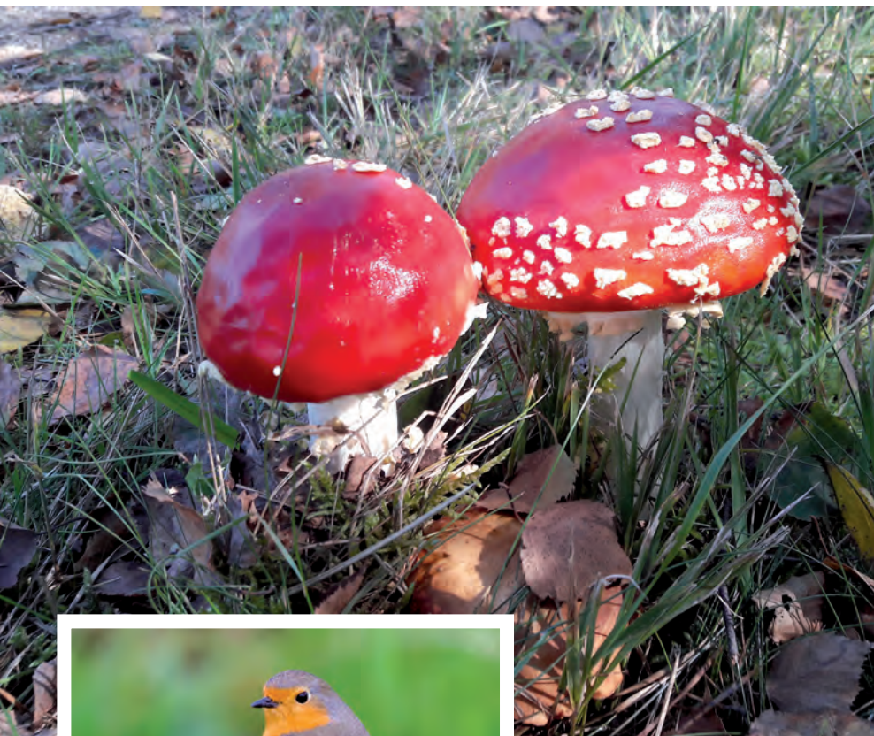
Die Fliegenpilze entdeckte Rainer Koppe aus Viersen im Elmpter Schwalmbruch.

Die besten Naturfotos unserer Leserinnen und Leser stellen wir Ihnen an dieser Stelle vor. Ihre eigenen Fotos können Sie an naturspiegel@nabu-krefeld-viersen.de senden.