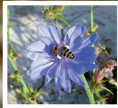
Auch Bienen mögen die Pflanze